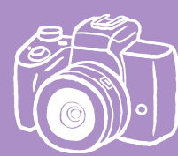
PHOTO SOUVENIR DE LA CLASSE

RETROUVE L'ORDRE DES ÉTAPES DU TRAVAIL DE LA LAINE :